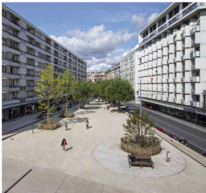
Le nouvel aménagement de la place du Velodrome à la Jonction.